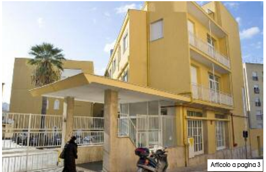
Articolo a pagina 3