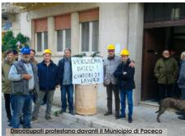
Disoccupati protestano davanti il Municipio di Paceco