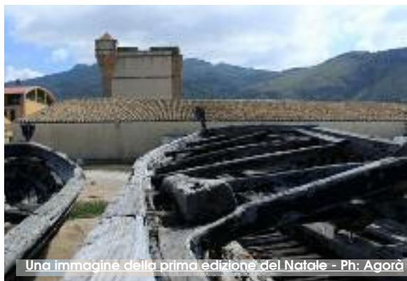
Una immagine della prima edizione del Natale